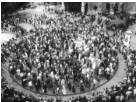
Das FRAUEN-GEDENK-LABYRINTH Der Einweihungsgang durch 1000 Frauen. 1. Juni 2000 Frankfurt/Main