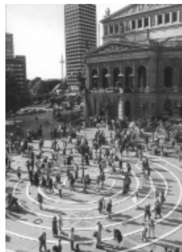
Das FRAUEN-GEDENK-LABYRINTH Abschluss des Einweihungsganges durch 1000 Frauen. 1. Juni 2000 Frankfurt/Main