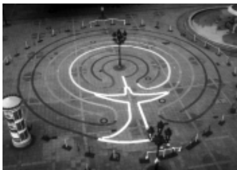
Das FRAUEN-GEDENK-LABYRINTH am Morgen vor seiner Einweihung. Die gravierten Steine sind mit Tüchern bedeckt. 1. Juni 2000 vor der alten Oper Frankfurt/Main

In den USA lernte ich die transportablen Labyrinth Tools kennen: die schwere Leinwand mit dem Labyrinth von Chartres darauf transportieren die Leute mit einem Rolli für Golfschläger... und viele haben zu Hause ein Stein- oder Tonlabyrinth, etwa so gross wie eine Tortenplatte, in dem sie mit dem Finger wandeln; das gilt als ausgezeichnete Entspannungs- und Konzentrationsübung, denn die Gänge in wechselnder Richtung entsprechen in gewisser Weise den Hirnströmen der beiden Hemisphären, die über die Brücke – die Mitte – von rechts nach links und von links nach rechts fließen.